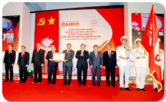
Ban lãnh đạo công ty CADIVI đón nhận Huân chương lao động hạng Nhất (lần thứ 2) trong buổi lễ kỷ niệm 40 năm thành lập công ty (ngày 4/10/2015).

Để chuẩn bị vững vàng trước những thách thức và đón đầu nắm bắt các thời cơ trong thời buổi hội nhập kinh tế của nước nhà, giai đoạn 5 năm gần đây, CADIVI đã có những bước đầu tư phát triển đáng kể như: đưa vào hoạt động nhà máy tại Khu công nghiệp Tân Phú Trung (huyện Củ Chi, TP.HCM) với mức đầu tư giai đoạn một trên 200 tỷ đồng. Nhà máy