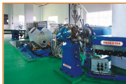
Đầu bọc 3 lớp và máy đo đường kính Triple-layer crosshead and X-ray triple-layer measuring SIKORA