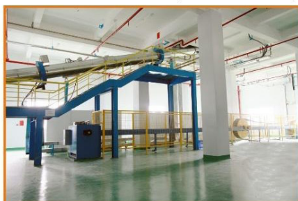
Bộ tích lũy Accumulator