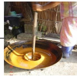
Sau khi nấu xong, lấy ra khỏi chảo, tiếp tục khuấy khoảng 30 - 60 phút.

đường chuyển sang màu đen và có mùi thơm. Nhấc khỏi bếp, tiếp tục khuấy đều khoảng 30-60 phút là có thể đóng chai để sử dụng, với thời hạn khoảng 2,5 năm.