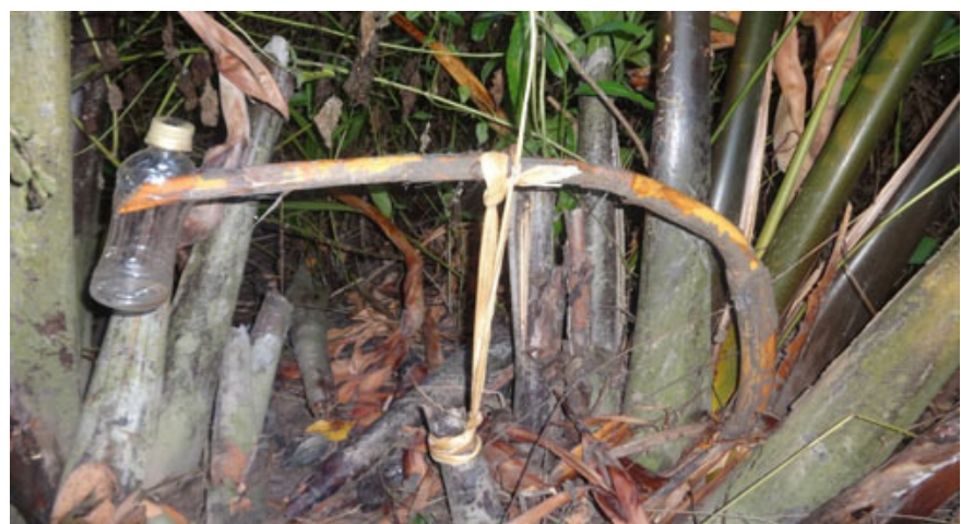
Hình 2: Dùng chai thu dịch nhựa từ cây dừa nước.

Bước 3: kích thích cuống buồng quả bằng cách uốn cong buồng quả xuống sát mặt đất, sau đó dùng cà bắp đập nhẹ vào cuống buồng (hoặc dùng đoạn gỗ ngắn dài khoảng 30 cm, rộng 4 cm có cuộn lớp vải ở ngoài để tránh làm trầy xước cuống buồng khi kích thích), đều