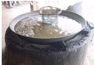
Đổ dịch nhựa vào chảo và khuấy đều.