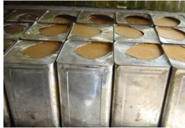
Kết quả: sản phẩm đường màu vàng tươi, vị ngọt, mùi thơm.