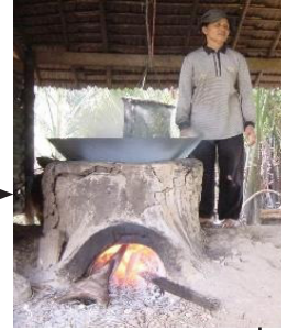
Đun sôi với lửa vừa phải để lấy đường dừa nước.