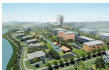
Phối cảnh nhìn từ hướng bờ sông. Kiến trúc thấp tầng từ 4 hướng, cao dẫn khí vào trung tâm