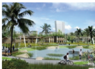
Không gian xanh, thân thiện môi trường

Riêng đối với các dự án thành lập trung tâm đào tạo và trung tâm ươm tạo, vui lòng tham khảo thông tin chi tiết tại www.shtp.hochiminhcity.gov.vn , mục Đầu tư vào KCNC