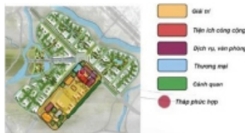
Các phân khu chức năng