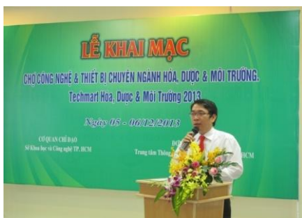
Techmart chuyên ngành