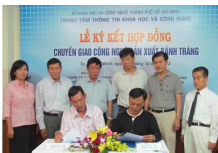
Dịch vụ tư vấn, hỗ trợ, mua bán - chuyển giao CN&TB