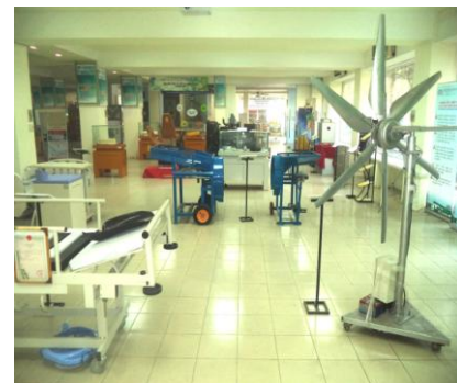
Khu trưng bày, chào bán CN&TB