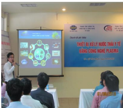
Dịch vụ tổ chức hội thảo trình diễn CN&TB