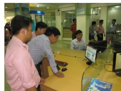
Dịch vụ tra cứu, cung cấp thông tin CN&TB